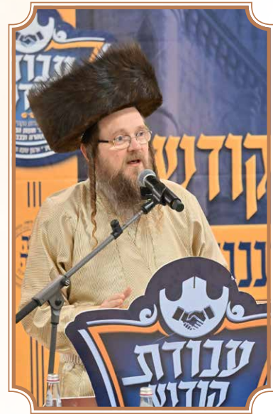
הגאון רבי אברהם צבי נואם באסיפת רבני הקהילות

מו"צ העדה החרדית, חדב"נ כ"ק אדמו"ר ד'קהל חסידי ירושלים' שליט"א ומרבני ק"ק תולדות אהרן