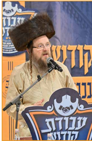
נאם: הגאון רבי אברהם צבי פטוויץ שליט"א חבר וועד רבני 'עבודת קודש'