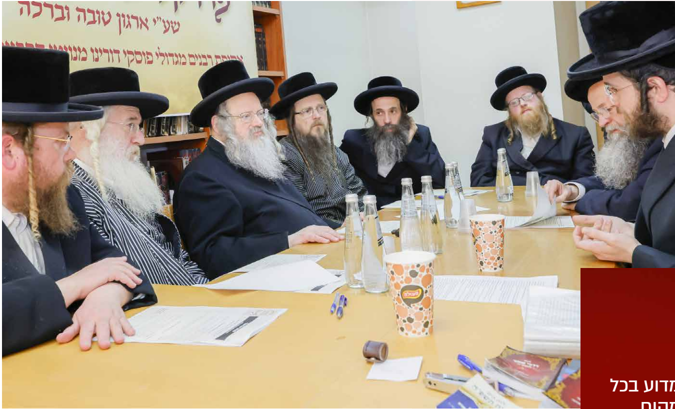
אנשי שיחנו באסיפת רבני עבודת קודש בבית הוראה של הגאון הגדול רבי משה שאול קליין מנשיאי עבודת קודש

הדברים יוצאים מן הלב - לב המתעסק מדי יום ביומו בדחק ונאקת פרנסת עמך בני ישראל. עתה ביקשנו מן העסקנים החשובים לגלות בפנינו עוד מפרטי המיזם,