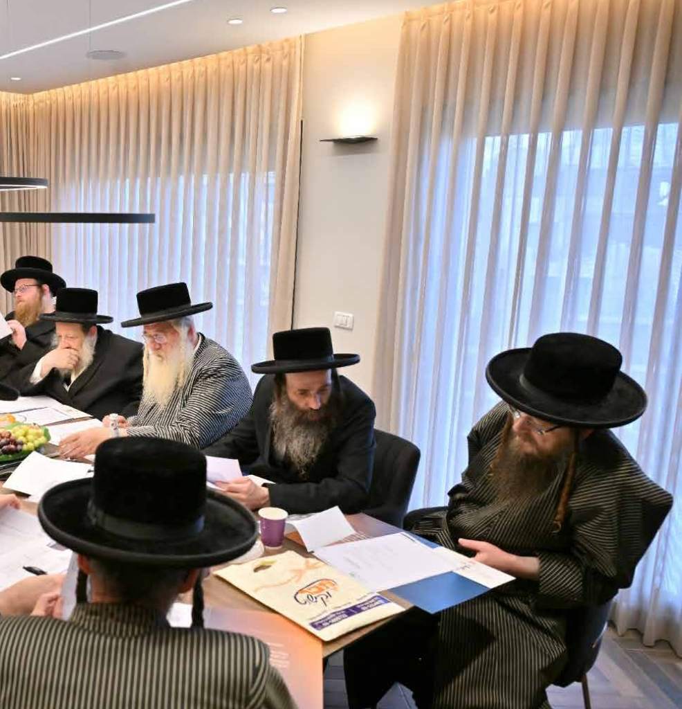
אנשי שיחנו באסיפת רבני עבודת קודש בראשות הגאון הגדול רבי שמואל בראנסדורפער שליט"א מנשיאי עבודת קודש במשרדי טובה וברכה

"בשנות מגוריי בארה"ב הייתי מגיע לבקר בארץ לעיתים תכופות. באחד הביקורים נכנסתי למאפיית נחמה בעי"ת בית שמש. בעומדי בתור ניגשו אליי שני חסידישע הערליכע יינגעלייט, ושאלו: "דו ביסט רפאל וואהל?" הנהנתי בחיוב. נוצרה בינו שיחה במהלכה הם סיפרו שהם טשערנובלע'ר חסידים שעובדים כדרייווער'ס, ואז תוך כדי שיחה פתח אחד מהם במזנוולוג אישי: "מיין חלוס איז