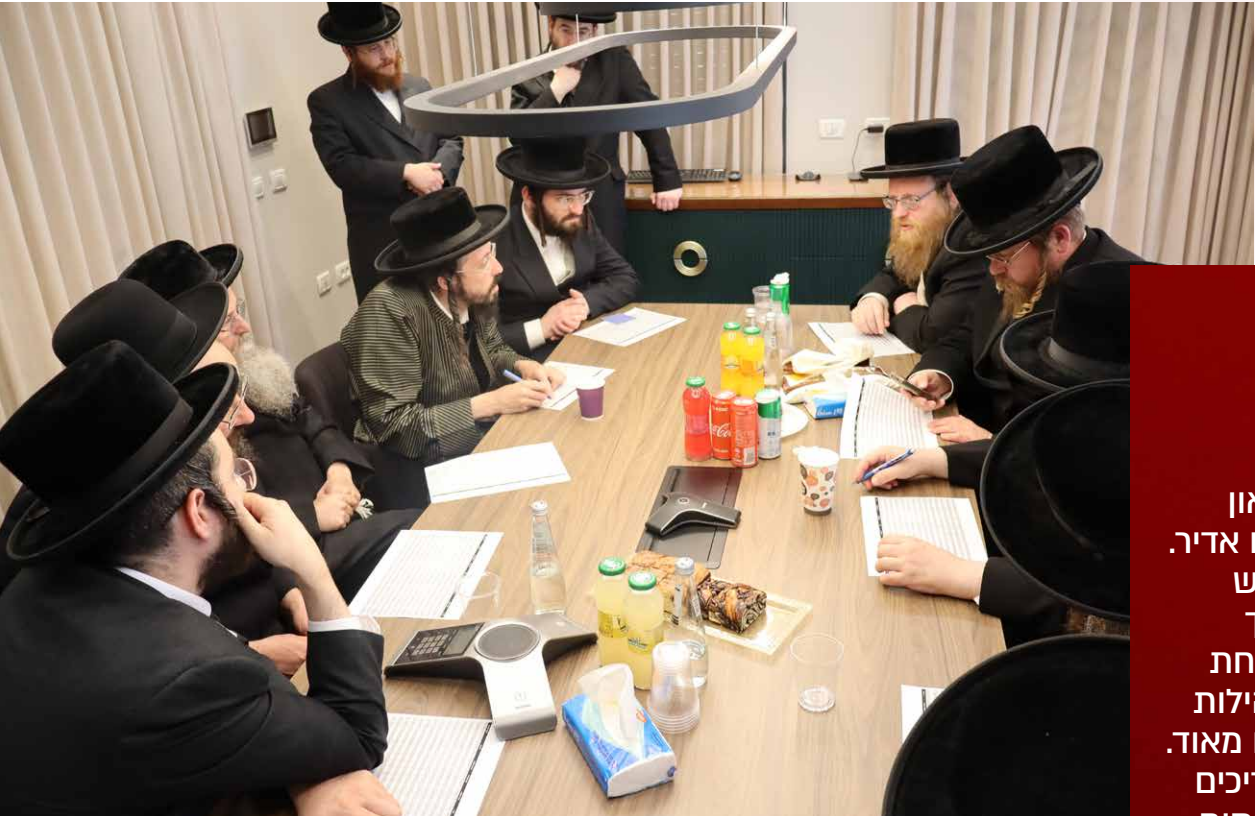
אנשי שיחנו באסיפת נשיאי ורבני עבודת קודש במשרדי טובה וברכה

הצימאון בשטח אדיר. הביקוש והצורך בכל אחת מהקהילות גדולים מאוד. אנו צריכים רק לפתוח את השערים בפני מי שמוכשרים ורוצים לעסוק בכך. בעזרת השם, בתוך ימים אחדים נתחיל בקבוצות של היימישע יונגעלייט, שיחלו בהכשרה קצרה ומעשית וייכנסו לעבוד במלאכות אלו."