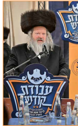
נאם: נשיא עבודת קודש הגאון הגדול רבי משה שאול קליין שליט"א ראב"ד וויז'ניץ ובעל 'שאלת משה'

לצורך פרנסה יקבעו עתים לתורה וימשיכו לעלות במעלות התורה והיראה.