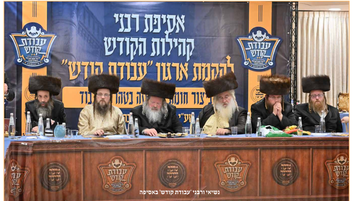
נשיאי ורבני 'עבודת קודש' באסיפה

הארגון הוקם על ידי עמודי ההוראה שליט"א וכלל רבני חצרות הקודש שליט"א לביצור קדושת המחנה במטרה שכלל המלאכות הנצרכות בבתינו בשכונותינו יבוצעו בידי חרדים לדבר ד' באופן הנקי והטהור ביותר // רבני חצה"ק מינו עסקנים חשובים אשר ינהלו את 'אגף עבודת קודש' בכל קהילה // צאו והתפרנסו זה מזה והיה מחניך קדוש!