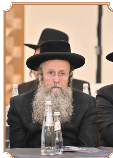
ר' יעקב באסיפת באסיפת היסוד לראשי חצרות הקודש

זכורני כי לפני שנים מספר, אחד מתלמידי החכמים החשובים בעיה"ק ירושלים, הגיע לפגישה במשרדי 'טובה וברכה' במטרה להסדיר את ההתנהלות הכלכלית היומיומית ולהקל בעול הגדול של החובות עימן הוא התמודד. כאשר עברנו על ההוצאות שלו נוכחנו לראות שההוצאות החודשיות שלו אמורות להיות נמוכות ממש. הוא סיים זה מכבר להשיא את ילדיו והם עצמם כבר עמדו בשלב נישואי ילדיהם, ולכן מטבע הדברים אף התארחו אצלו בשבתות רק מידי פעם. משכנתא כבר לא הייתה לו. ולכן, בנימת כבוד נדרשת, שאלתי אותו כיצד הוא מסביר את ההוצאות החודשיות הכבירות.