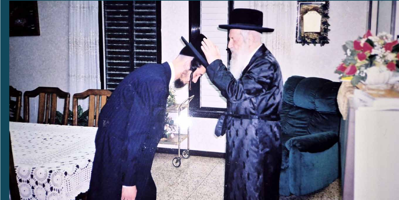
מיין טייערער יואלי. ר יואל מתברך ע"י זקנן מרן פוסק הדור הרב וואזנער צוק"ל

יעמדו לנו לעיניים דבריו הקדושים של מרן פוסק הדור זי"ע ויבלחט"א גדולי ההוראה ורבני קהילות הקודש שליט"א: אין שום מקצוע שאינו מכבד את בעליו. להפך ראוי לכל בעל מלאכה לחזר אחרי המקצוע שהקב"ה חנן אותו בכשרונות עבורו. זהו כבודו של אדם. הכבוד