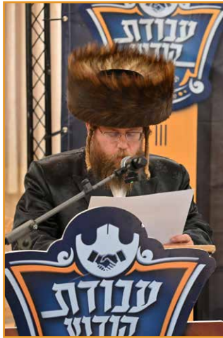
נאם: הגאון רבי אברהם שרגא שטינליץ שליט"א חבר וועד רבני 'עבודת קודש'